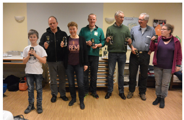
Gewinner des Ikeataschen Suchwettbewerbs